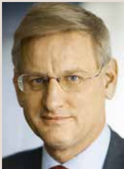
في الأعلى: كارل بيلدت