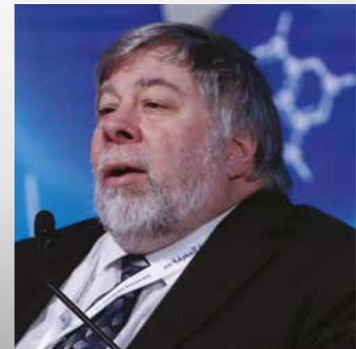
على اليسار: ستيف وزنيك متحدثاً في قمة المعرفة

يذكر وزنيك أنه في أحيان كثيرة تروي قصصاً بها مزاج ودعابة تقود تفكير وعقول