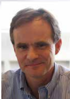
في الأعلى: سايمون جونسون

ومضات - واشنطن - سايمون جونسون* هناك إجماع متزايد على أن لقاحاً واحداً أو أكثر ضد فيروس كورونا المستجد سيكون متاحاً في وقت ما في أوائل عام 2021. وفي غضون عام من الآن، سيتم تطعيم العديد من الأشخاص في الولايات المتحدة وبعض البلدان الأخرى. بالنسبة لبعض أمراض الطفولة، لعب تطوير اللقاح في حد ذاته دوراً حاسماً. لكن قد لا يكون هذا هو الحال بالنسبة لفيروس كوفيد 19، لأن التطعيم قد يكون بطيئاً نسبياً أو قد تنخفض فاعليته مع مرور الوقت أو كليهما.